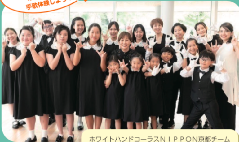
ホワイトハンドコーラスNIPPON京都チーム (@ 京都女子大学)

ホワイトハンドコーラス NIPPON京都チームの みんなと一緒に 手歌体験しよう!